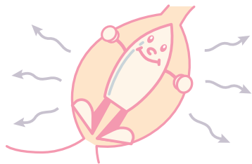
直腸内・イメージ図

ボルタレン®サポは、体温で溶けて 直腸粘膜から吸収され効果を 発揮するように製剤設計されています。 ですから、冷所保存となっております。